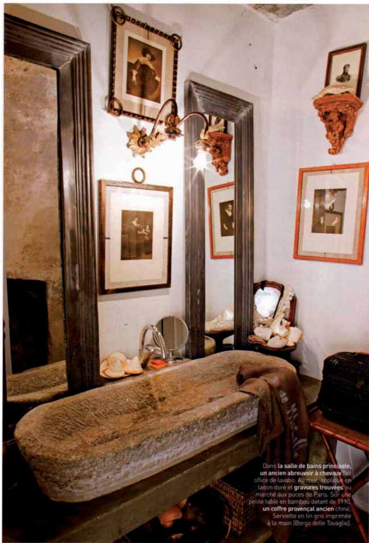
Dans la salle de bains principale, un ancien abreuvoir à chevaux fait office de lavabo. Au mur, applique en laiton doré et gravures trouvées au marché aux puces de Paris. Sur une petite table en bambou datant de 1910, un coffre provençal ancien chiné. Serviette en lin gris imprimée à la main (Borgo delle Tovaglie).