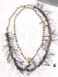
4. Lunettes optiques, Miu Miu, 151 € (prix indicatif). 5. Parfum Quel Amour ! 100 ml, Annick Goutal, 85 €. 6. Collier de perles nacrées, Dior, 1500 €.