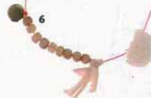
4. Bottine en chèvre, MOU, 249 €. 5. Sac à jouer en papier recyclé, Cocobohème, 8,75 €. 6. Collier April Showers by Polder, 42,50 €.