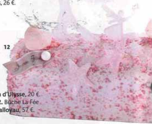
10. Théière Macaron en céramique, Jardin d'Ulysse, 20 €. 11. Moule à gâteau sapins, Merci, 39 €. 12. Bûche La Fée des Bois, meringue et biscuit framboise, Dalloyau, 57 €.