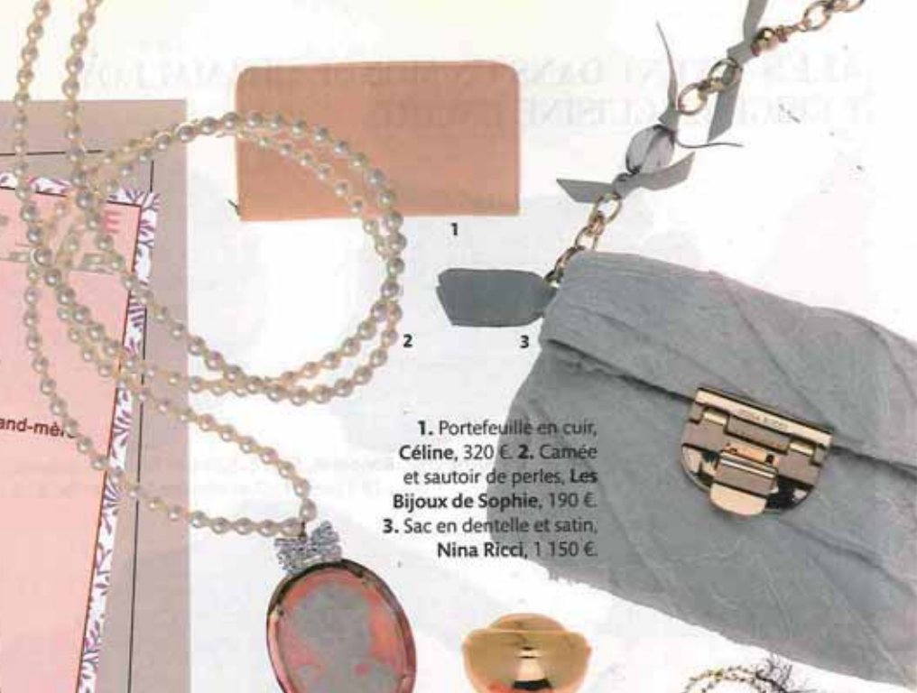
1. Portefeuille en cuir, Céline, 320 €. 2. Camée et sautoir de perles, Les Bijoux de Sophie, 190 €. 3. Sac en dentelle et satin, Nina Ricci, 1 150 €.