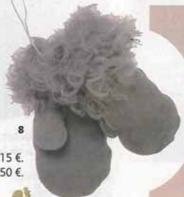
7. Animaux en bois, Muji, 15 €. 8. Mouflas Louis Louise, 50 €.